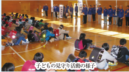
子どもの見守り活動の様子