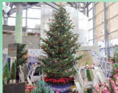
昨年のクリスマス展の様子