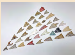
縄文時代の石鏝 (村上市上野遺跡)

3月3日(日)①午前10時～正午 ②午後1時～4時 ①2023年度調査成果報告 ②シンポジウム「柏崎市丘江遺跡の木製塔婆からみた中世の葬送」