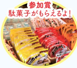
参加賞 駄菓子がもらえるよ!

秋葉区を巡って、たくさんの魅力を見つけよう!期間中に3つのミッションの写真を撮って応募すると、抽選で「秋葉区魅力たっぷりプレゼント」が当たります。夏休みにたくさんの思い出を作りましょう!皆さんの思い出の写真、お待ちしております!