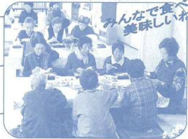
みんなで食べると 美味しいねえ!