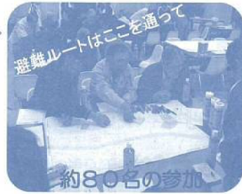
避難ルートはここを通過

*地図を用いて防災対策を検討する訓練のこと 小須戸地区公民館3階ホールで図上訓練の様 (4ページにも関連写真等を記載してあります)