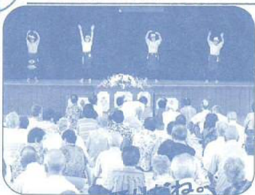
小須戸地区敬老会