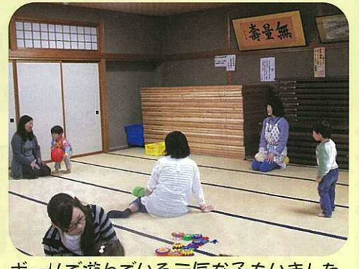
ボールで遊んでいる元気な子もいました。ここでたくさん遊ぶとお昼寝もしっかいしてくれるから助かるそうです。