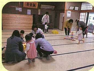
みんなでお片付け。楽しかったね!