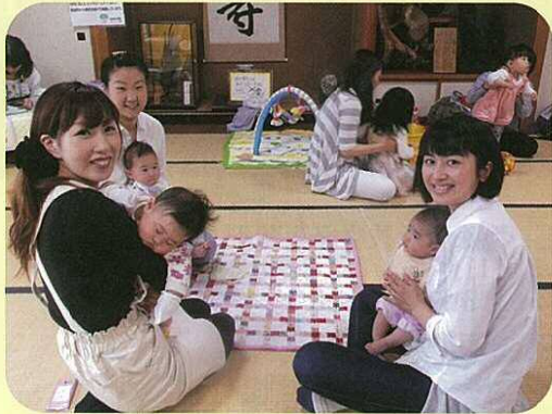
0歳のお友達も来ていました。家の中でママの子育てはつらいこともあるけど、ここで話せるのが気分転換になるそうです。