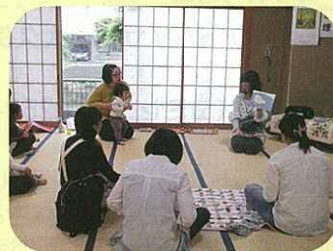
さいごに絵本を読んでもらったし、歌を歌ったしして...