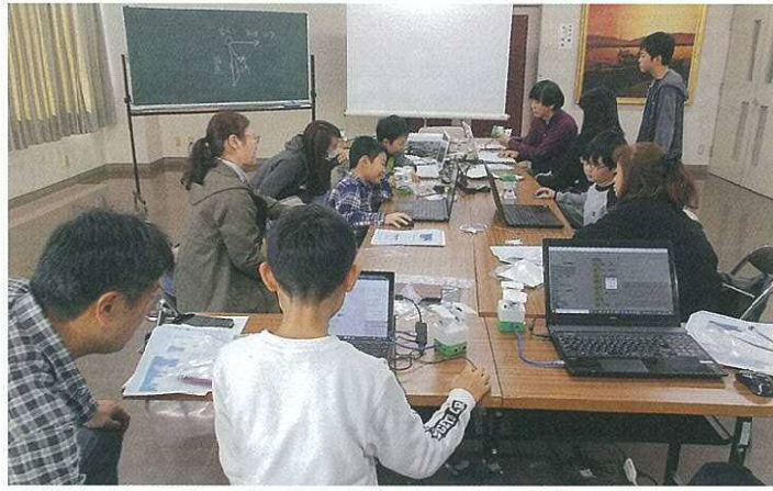
2足歩行ロボット作成教室(11月の文化祭に開催予定)

文化教養部 文化教養部では、6月14日に芸能祭、5月～6月には大人の陶芸教室の開催を予定しておりましたが、感染拡大防止のために中止となりました。 芸能祭は、日頃の稽古の成果を披露する機会ですので残念に思われた方も多いと思います。 人が集まる事ができない状況で、部会も最近になって開催したところです。 今後の活動もまた制限されたものになるかと思いますが、できる範囲でやれることを検討していきたいと思っています。 今月末には11月に開催予定の文化祭について実行委員会を開いて協議致します。今後の状況次第ですが、いつもとは違った形を取らざるを得ないかも知れません。 世の中では、インターネットを使ったオンライン会議やビデオでの授業やダンスレッスンなどが盛んになってきました。今年も出来なかつた芸能祭ですが、演目によってはビデオでの発表、オンラインでの発表などできる可能性はあると思いますのでそちらの検討もしてみたいと思っています。