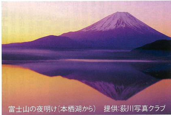
富士山の夜明け(本栖湖から)