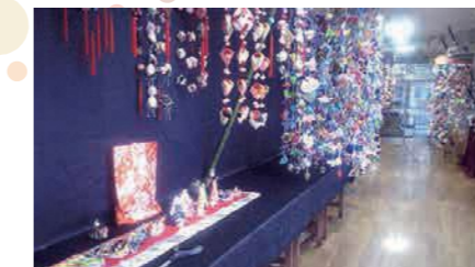
新潟コミュニティセンター