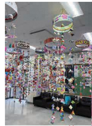
荻川コミュニティセンター