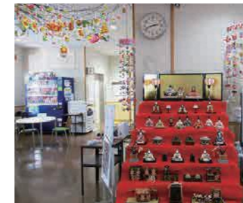
小須戸まちづくりセンター