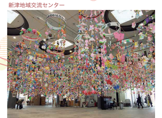
新津地域交流センター