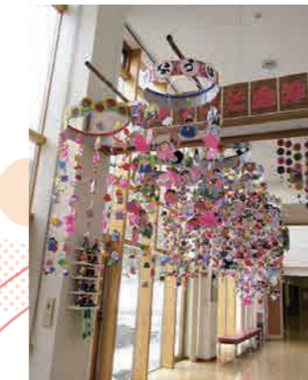
金津地区コミュニティセンター

秋葉区自治協議会では、今年も、秋葉区全てのコミュニティ協議会が協働して、「秋葉区ひな・お宝めぐり」を開催しました。秋葉区内の各団体のご協力のもと、秋葉区全域で開催することができました。参加団体は148団体にものぼり、秋葉区の子どもから大人までが心を込めて作った、たくさんのつるし飾りが秋葉区内を彩りました。