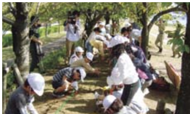
信濃川やすらぎ堤チューリップ植栽