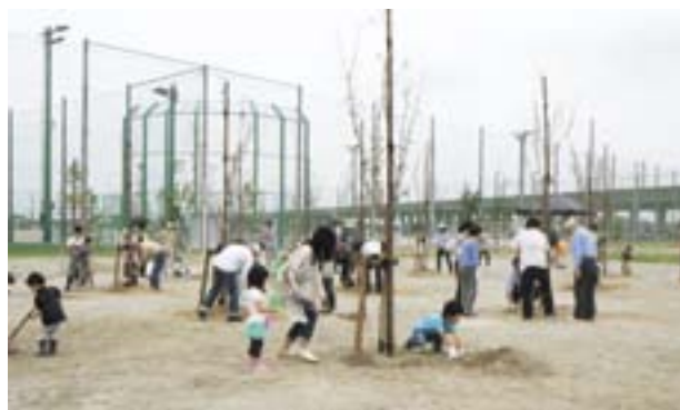
市民記念植樹（みどりと森の運動公園にて）