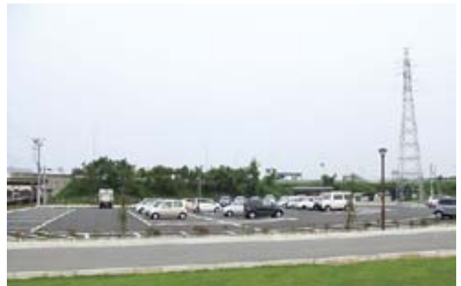
巻・潟東インター駐車場（平成24年度供用）