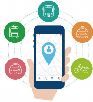
移動データ利活用プロジェクト