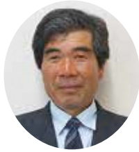
猪爪 清正 (農政振興) (内 野)