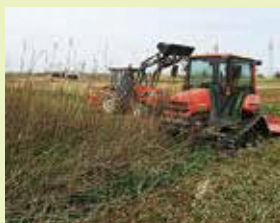
耕作放棄地の保全活動 (黒埼地区)

農地は大切な資源です。地域の優良な農地を、皆さん一人一人の意識や行動で守っていきましょう。