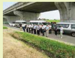
違反転用解消地の確認 (中野小屋地区)