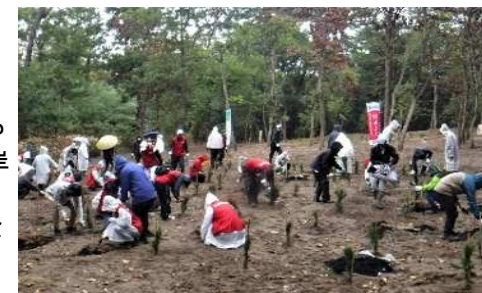
(事業1:西海岸公園でのクロマツ苗木植樹)