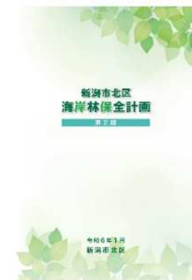
(事業1:北区海岸林保全計画第2期)