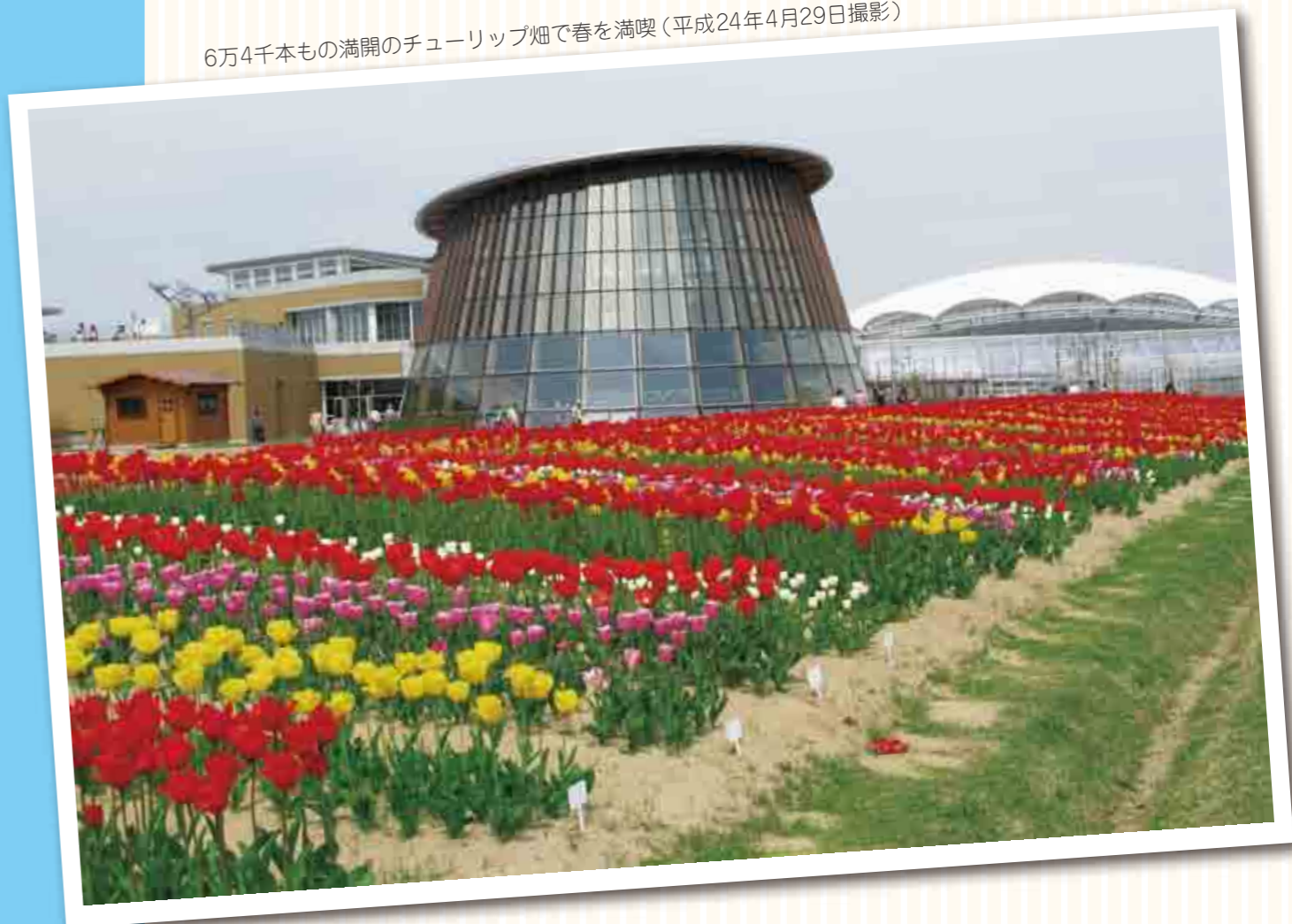
6万4千本もの満開のチューリップ畑で春を満喫(平成24年4月29日撮影)