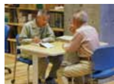
園芸相談コーナー 食育・花育センター1F