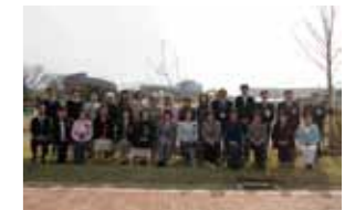
植樹された木の前で記念撮影。満開の時期が楽しみです。