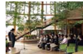
記念式典はアトリウムにて行いました。