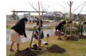
国際ソロブチミスト新潟 西クラブの皆さんの手で植えていただきました。