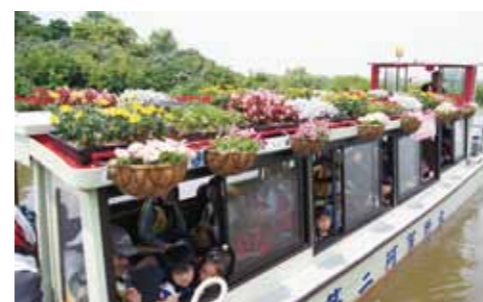
客船の上部はペチュニアやマリーゴールドなどのきれいな花で彩られました。

鳥屋野潟への理解を深めるイベントがグランドオープンに合わせて実施され、約 1,100 人が参加しました。きれいな花で飾り付けされた阿賀の里の客船で、潟の中心までの往復約 25 分を遊覧し、「とやの潟の大きさ」を実感できる貴重な体験でした。