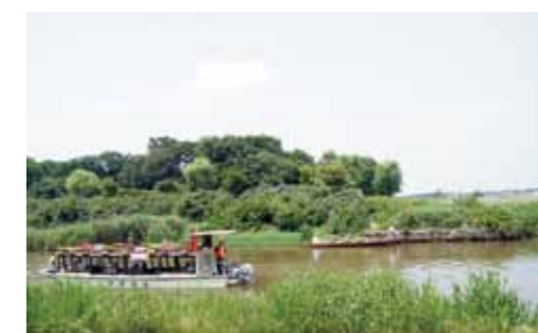
鳥屋野の水面は日本海より 3 メートルも低いんです。