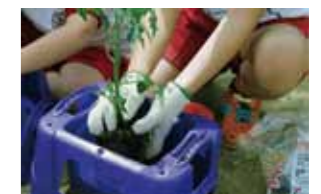
自分の目で選んだ苗を大切にそっと植えます。たくさん実るといいね。