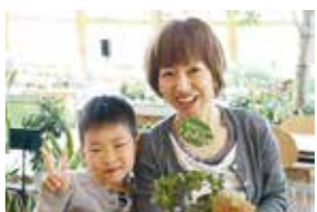
その場でお母さんにプレゼント。 ふたりとも、とってもいい笑顔。