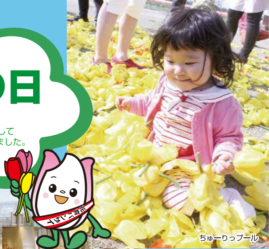
ちゅーりっプール