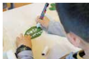
最後に、葉っぱに感謝の気持ちを 書きこんで...