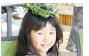
香りのよいリースを頭にのせて、 ハーブの冠にしていた子も。