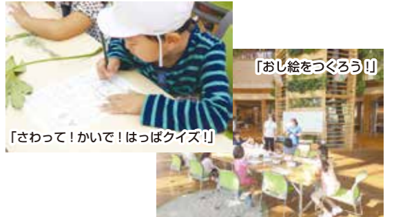
「おし絵をつくろう!」