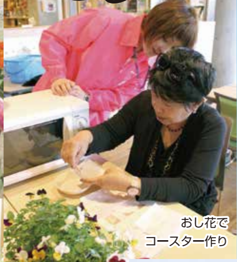
おし花で コースター作り