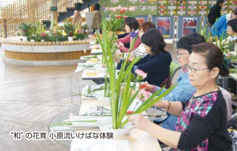
“和”の花育 小原流いけばな体験