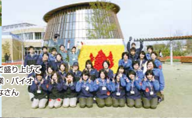
花育の日を スタッフとして盛り上げて くれた新潟農業・バイオ 専門学校のみなさん