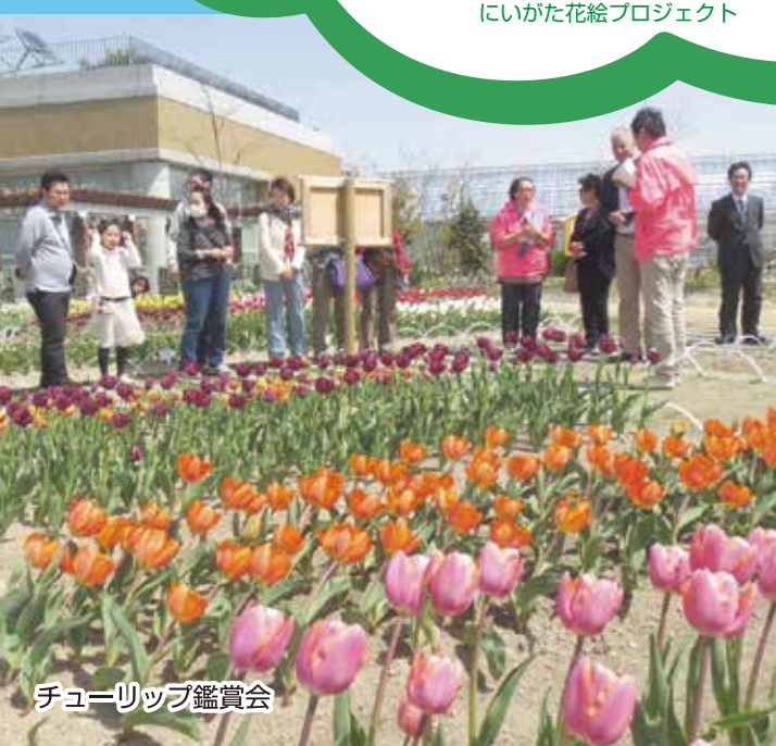
チューリップ鑑賞会