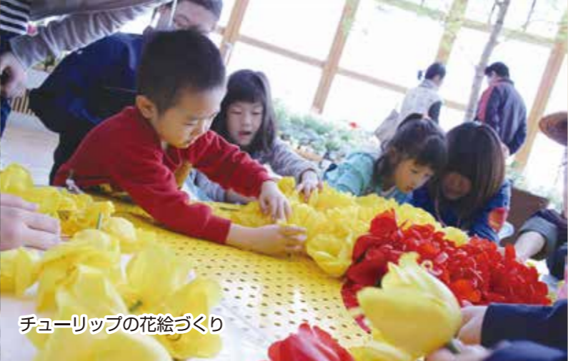
チューリップの花絵づくり