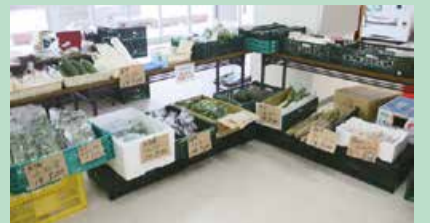
朝仕入れた新鮮な野菜や果物を提供！