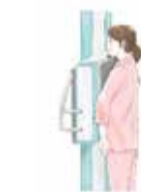
肺がん検診のイメージ 中央区健康づくりリポーター 中央子(なか ちかこ)