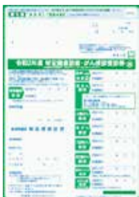
市国保加入者用受診券