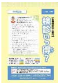
各種健診のご案内「検診いつ得?」