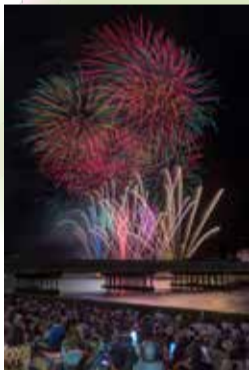
@step.wgn1787さん 【新潟まつり花火大会】