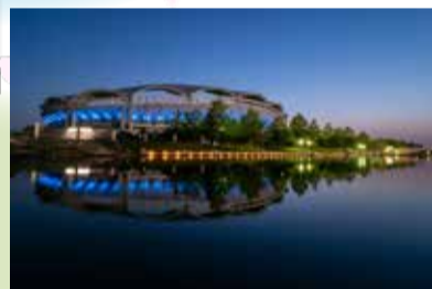
@cat0lymさん 【ビッグスワン】