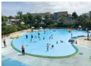
東公園児童プール

水泳帽子を着用しましょう。休館日以外や無休の施設でも天候や水質状況、大会などにより休館する場合があります。☉マークは付き添いが必要です。付き添い人の条件などは各施設にお問い合わせください。オムツが取れていない子どもは水泳用オムツを着用してください。