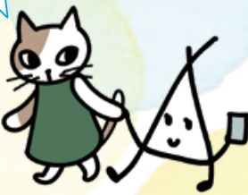
イラスト:西山りっく