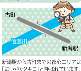
新潟駅から古町までの都心エリアは「いがた2キロ」と呼ばれています。

現在、新潟駅舎のリニューアルをはじめ、新潟の都心が大きく変わろうとしています。このエリアにはあまり知られていない魅力も埋もれているのではないのでしょうか。新潟をもっと元気にし、活気を感じ「歩きたくなるまち」のきっかけ作りを検討しています。