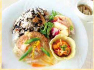
ヘルシー和風ハンバーグ ディッシュ (提供店:カフェテラスピーア)