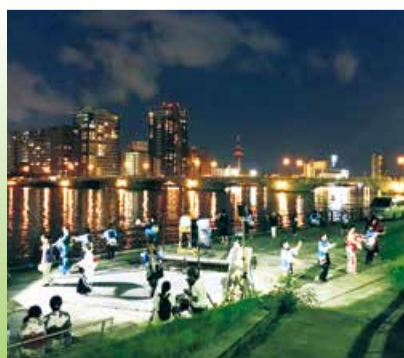
萬代橋誕生祭の様子