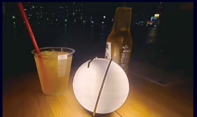
おしゃれなランプで気分も上がる