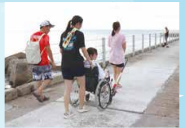
▲突堤までの移動を検証

行ける場所が増えることは、地域の活性化にもつながる。日和山浜の活動を継続的に発信することでさまざまな地域で広がっていくことを期待したい」と笑顔で話しました。