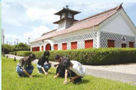
▲旧税関庁舎前でまつぼっくりやクローバーの葉などを採取

子どもたちに夏休みを楽しんでもらおうと、異なる学校の高校生ボランティアが集まり、8月11日に「みなとびあたいけんのひろば なつまつり」を実施しました。企画から当日の運営までを学生主体で行うこのイベント。学生たちは、トンボ作りやむかし遊びのほか、新しい体験プログラムとして釣り堀、植物絵本の作成を実施することにしました。準備に取りかかった植物絵本の担当学生は、会場で周辺の植物を採取し、絵の具で色づけして試作品を制作。採取した植物の説明や、体験の流れを確認していました。