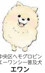
中央区ヘモグロビン エワンシー普及犬 エワン

・受診できるがん検診は、年齢や加入している健康保険によって異なります。詳しくは、保険者にお問い合わせください。 ・新潟市の受診券は、新潟市国民健康保険、後期高齢者医療保険、そのほかの健康保険加入者でがん検診の受診の機会がないと思われる人に発送しています。新潟市国民健康保険、後期高齢者医療制度ご加入者以外でがん検診の受診券が必要な人は、健康福祉課健康増進係にお問い合わせください。