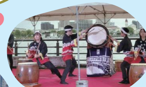
ステージイベント