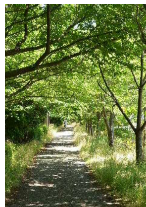
「木漏れ日の散歩道」 丸山 勉