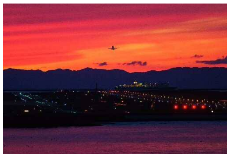
「燃える空港」大越 県司