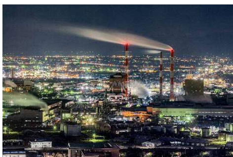
「煌めく街」 石月 孝幸