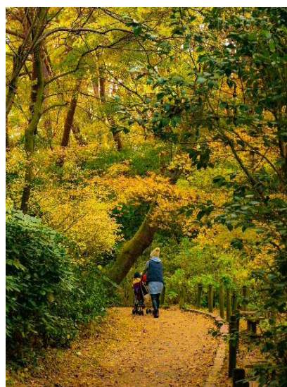
東区の四季部門 「秋散歩」 穂苅 環