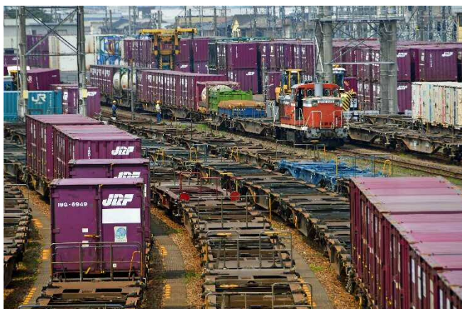
産業のまち部門 「働き者」 鷺澤 拓弥