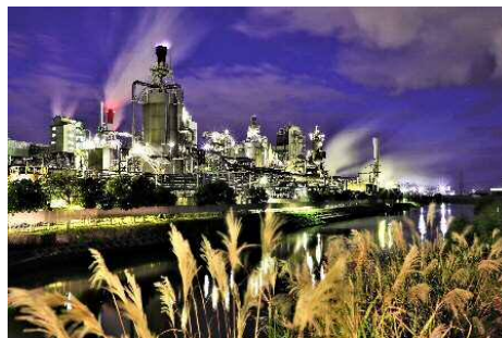
「晩秋の工場夜景」中野 金吾