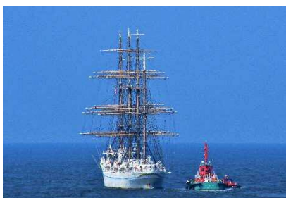
「See you again」二瓶 純緒