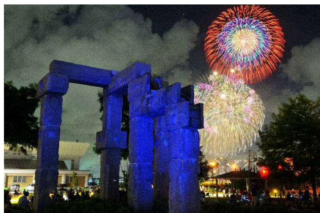
東区の四季部門 「神殿とござれや花火」石津 不二男