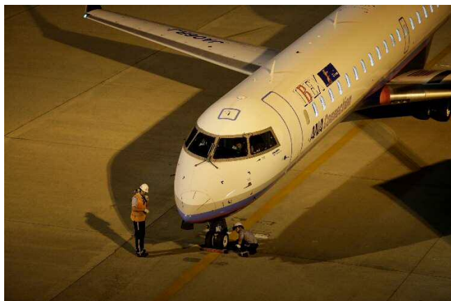
産業のまち部門 「出発前点検」石塚 栄一