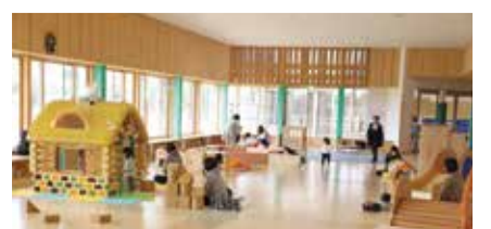
子育て交流施設「い〜てらす」