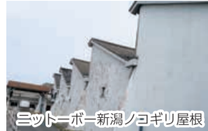
ニッポー新潟ノギリ屋根