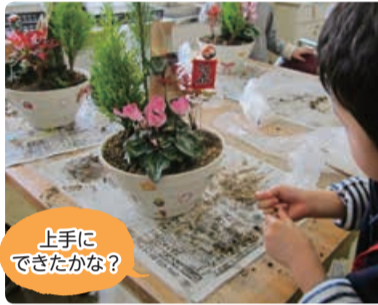
上手にできたかな？

工作やスポーツを楽しめる催しです。昨年12月は、小学生の子どもたちがお正月を迎える寄せ植えと飾り作りを行いました。講師に教えてもらいながら花の向きや配置を考え、とっても素敵な飾りができ上がりました！