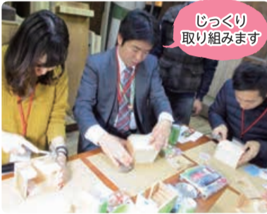
じっくり取り組みます

20～30代の人を対象に、体験を交えながら地域で働く人からお話を聞くセミナー。昨年11月の開催では、東区にある有限会社阿部仏壇製作所から新潟の魅力や製造業についてお話を聞き、木のポケットティッシュボックス作りに挑戦しました。