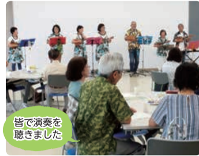
皆で演奏を聴きました

毎月第4月曜日(12月、祝日を除く)に、毎回違うテーマで学び、参加者どうしで話し合う交流の場です。お茶などを飲みながらおしゃべりして、ご近所の人と顔見知りになりませんか。