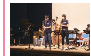
新潟ジュニアジャズオーケストラ