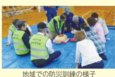
地域での防災訓練の様子

新潟市の市政世論調査でも、防犯・防災対策は東区において、常に力を入れてほしい施策の上位となっており、災害は決して起きてほしくない、日ごろの取り組みは大きな力を発揮します。今年も区役所と地域の皆さまと一体となり、安心・安全なまちづくりに向けて取り組んでいきたいと思います。