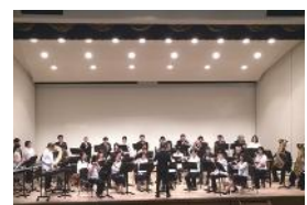
アクアブループラス