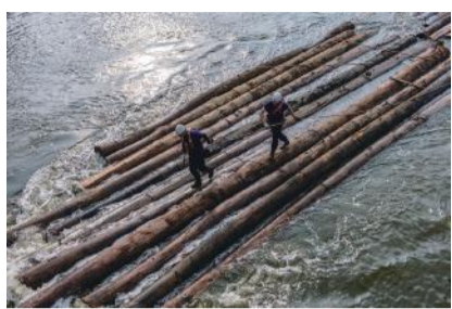
「筏流し」 上杉 正春