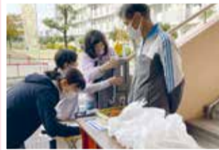
▲子ども食堂(お弁当の配食)の様子

子どもの育ちと地域の関わりについて、有識者などから話を聞いて理解を深めます。また、子ども食堂の現状や課題を調査し、支援のあり方を協議しています。