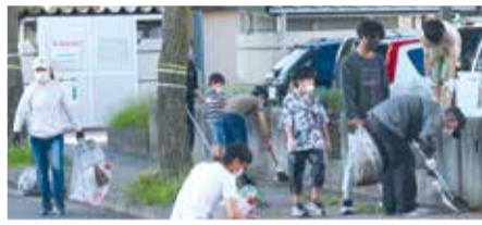
▲自治会活動(クリーン作戦)の様子

自治会・町内会役員や運営者の業務内容の現状を調べ、実際に活動している住民の声を聞いたり、他都市の事例を研究したりするなどして、令和4年度に実施する事業を検討しています。