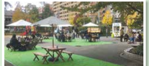
▲公園の利活用の事例/令和2年度(中央区 弁天公園における社会実験)

地域にある身近な公園の利活用について、検討しています。管理や活用の事例について市・区役所の担当部署にヒアリングを行い、令和4年度にどのような事業を実施すべきか協議しています。