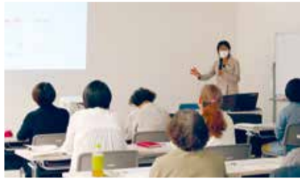
▲調査・研究の一環として学習会を実施「子どもの育ちと地域の関わりに関する学習会」

令和3年度の東区自治協議会提案事業は、地域課題について協議し、調査・研究を行っています。その結果を令和4年度の事業実施に生かしていきます。令和3年度の前半は、各部門別部会ごとにグループワークなどを通して、担当分野の地域課題を洗い出し、調査・研究のテーマを絞り込んでいます。