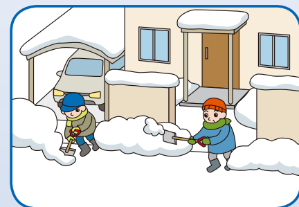
玄関先などの除雪へのご協力をお願いします。

自宅前は各家庭で除雪をお願いします。自力で作業できない場合は、地域の皆様のご協力をお願いします。