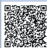
新潟市区バス位置情報システム「e区バス」(インターネット)