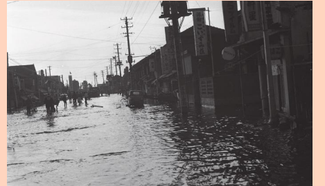
新潟地震による津波浸水被害