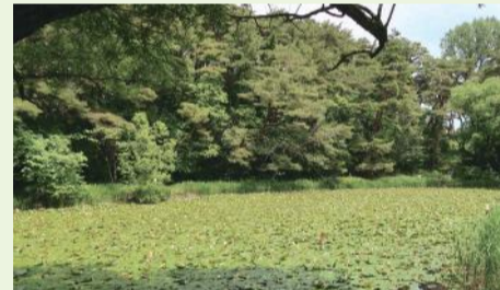
▲しばらく経つとまた繁茂してしまいます(令和3年5月撮影)