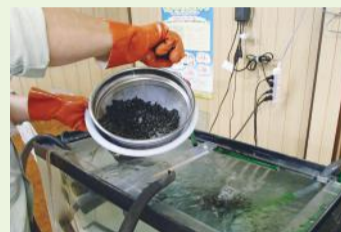
▲ホタルの幼虫に餌をやる様子

ここで見られるホタルは、年間を通じて別の場所で人工飼育し、時期が来たら放流しているものです。飼育には知識と経験が必要となりますが、担い手確保の課題などにより、継続が難しくなっています。