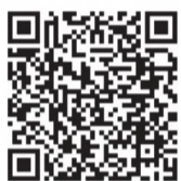
これまでの協議内容や資料はこちらから

日時 7月29日(木)午後2時から 会場 東区プラザ 定員 先着5人 問い合わせ 地域課(☎025-250-2110) ※6月の全体会議は休会します