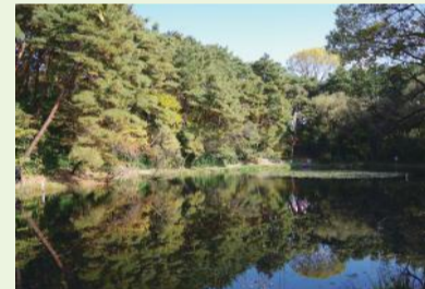
▲刈り取り後の様子(令和2年11月撮影)

今年度も刈り取りなどの環境整備活動を行う予定ですが、水底の地下茎で増え、繁殖力の強い園芸スイレンは、一度刈り取っても数カ月でまた広がってしまい、完全に取り除くことは困難な状況です。