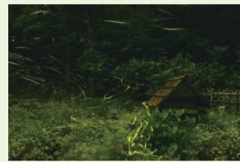
▲じゅんさい池で舞うホタル

東池に接する傾斜地に整備された「ホタルの里」では、毎年、6月下旬から7月上旬にかけて、ゲンジボタルが舞い、幻想的な光景が見られます。