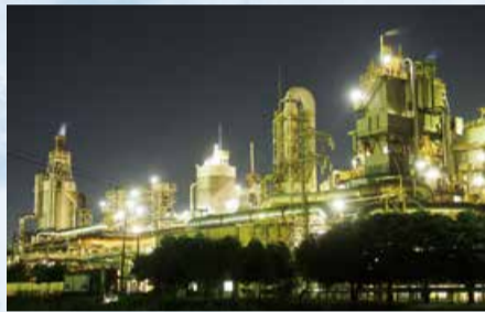
▲通船川鷗橋付近の工場夜景