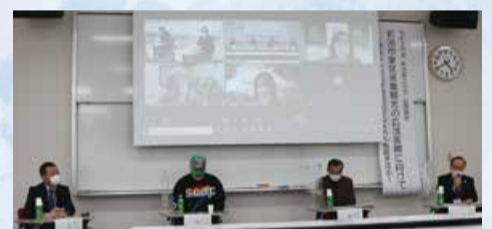
▲東区の産業観光の広域展開をテーマに開催した令和2年度新潟県立大学公開講座

東区の強みである産業を生かし、企業・新潟県立大学・区役所が連携し、地域課題の解決や、産業・まちづくりについての意見交換などを行うプラットフォームの構築を目指します。