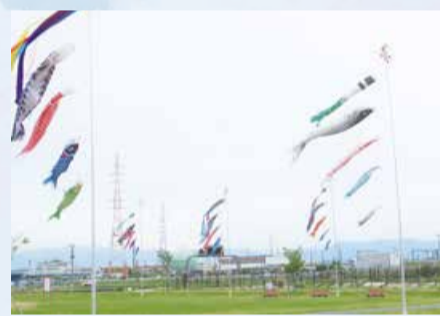
▲寺山公園でのこいのぼり掲揚の様子