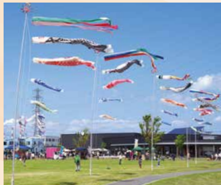
▲こいのぼりプロジェクト in 寺山公園