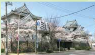
◀こども創作活動館