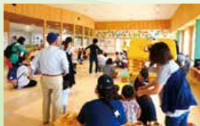
子育て交流施設「い〜てらす」▶