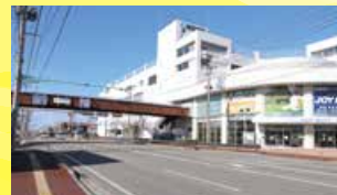
◀東区役所前横断歩道橋