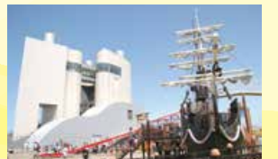
山の下みなとランド▶