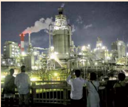
▲工場夜景バスツアー