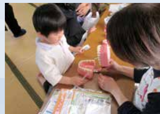
◀歯っぴーすまいるプロジェクト