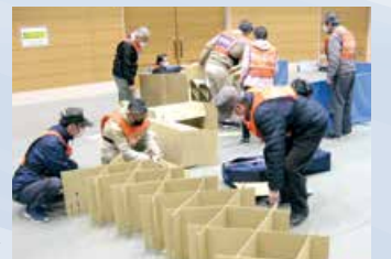
避難所運営ワークショップ▶