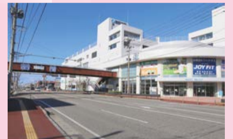
▲東区役所前横断歩道橋