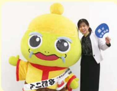
東区応援団長めたりんと東区長