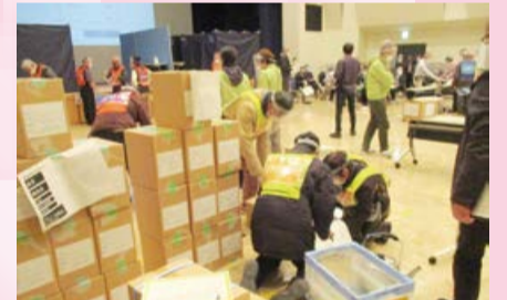
▲避難所運営ワークショップ