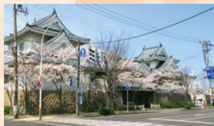
▲こども創作活動館

春の訪れとともに、新年度が始まり、新入学や新学年を迎えた子どもたちの元気な声が聞こえてくる季節となりました。東区長に就任して2年目の春を迎え、昨年度以上に区民の皆さまと一緒に、区政運営に努めていこうと気持ちを新たにしています。 今年度は、先ず、1月1日に発災した能登半島地震を踏まえ、さらなる地域防災力向上に取り組みます。津波の浸水想定や到達時間を表示した津波ハザードマップや津波からの避難行動、災害への備えなどを掲載したリーフレットを全戸配布します。また、例年開催している避難所運営ワークショップは、津波災害時における避難所運営がどうあるべきか、地域の皆さまと考えていきます。 「産業のまち東区」の魅力発信事業として、新たに「産業E産探求プロジェクト」に取り組みます。東区の歴史や産業遺産について学ぶ講演会やまちあるきを実施し、区内外の多くの方々に東区の魅力をPRします。また、昨年度からスタートし好評だった東区オープンファクトリーは、規模を拡大し、より多くの企業にご参加いただくことで「ものづくりのまち」にさらに磨きをかけていくとともに、例年多くの方からお申し込みいただいている工場夜景バスツアーについても、回数を増やし内容を充実させていきます。 環境整備として、新たに「寺山公園魅力アップ事業」に取り組みます。日陰施設の新規設置や植樹で緑を増やすなど、より快適な公園環境を整え、にぎわいや憩いのスペースとして魅力度を高めます。 東区が目指す区の将来像「産業と多様な魅力が調和し、心豊かに暮らせるまち」の実現に向けて、今年度も区役所職員一丸となり、全力で取り組んでまいります。引き続き、皆さまのご支援とご協力をお願いいたします。