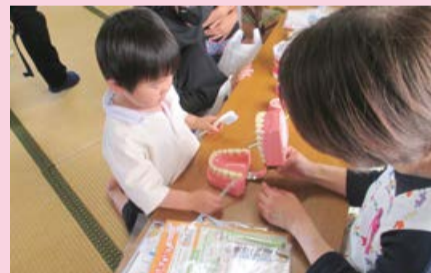
▲歯っぴーすまいるプロジェクト