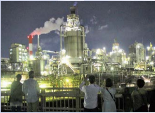
▲工場夜景バスツアー