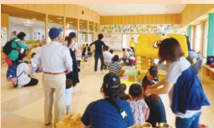
▲子育て支援施設「い〜てらす」