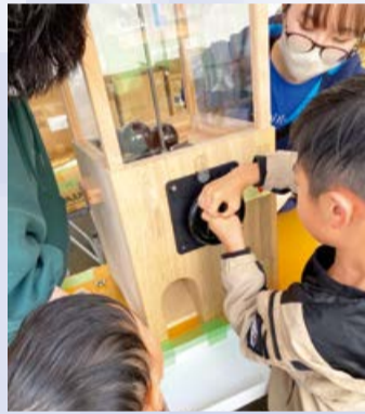
▲オープンファクトリー