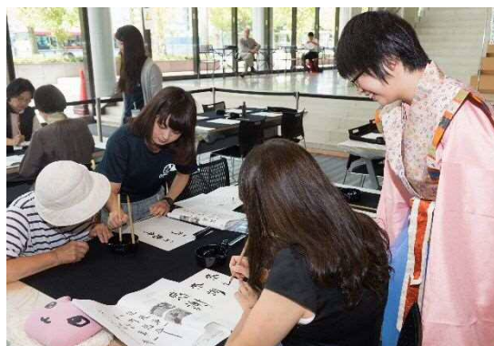
大学生によるワーク