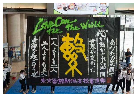
東京学館新潟高等学校による書道パフォーマンス