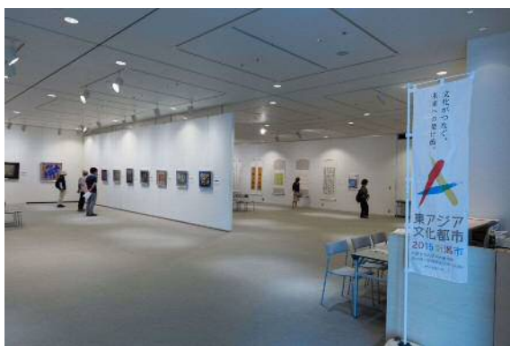
東アジア文化都市市民交流書道展