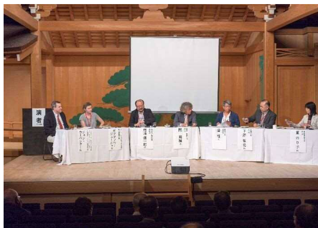
国際シンポジウム 共同討議

については、参加できるイベントということもあり、家族で参加されている方々も大勢おられ、思い出に残ることと思います。東京学館新潟高校書道部の皆さんによるパフォーマンスは、ダイナミックな動きから見事な書道作品を生み出し、多くの方を魅了しました。