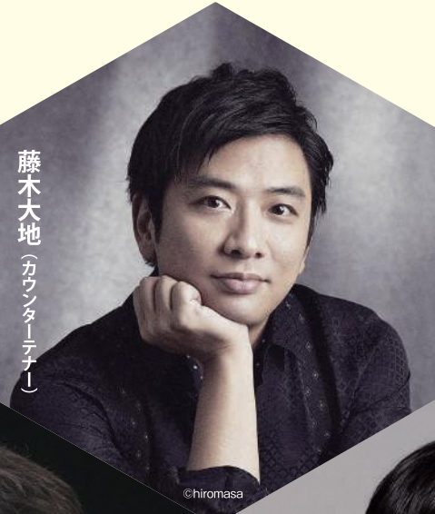
藤木大地 (カウンターテナー)

日本が世界に誇る 国際的カウンターテナーの 藤木大地と5人の名手による 珠玉の室内楽コンサート