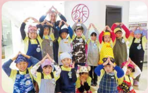
NIIGATA越前で笹山小学校の児童たちと