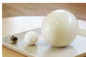
(ダチョウの卵はとよさかダチョウファームから提供)

8月4日(水)、二葉保育園でダチョウの卵を使ったクッキング体験が行われました。園児が見つめる先には3つの卵。ウズラの卵、ニワトリの卵、そしてひときわ大きいダチョウの卵。卵の種類により大きさが違うことにびっくりです。園児は話し合っ、ダチョウの卵でホットケーキを作る計画を先生と一緒に立てました。 「おいしくなーれ、おいしくなーれ」と材料を一生懸命混ぜ、ホットプレートで焼いて出来上がりです。ホットケーキは卵一つで園児21人全員分。 「うまく焼けた。おいしい」「ニワトリの卵よりさっぱりしている」と地域の食材を楽しくおいしく学んでいました。