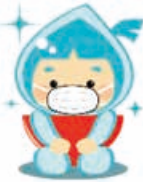
新潟市下水道キャラクター 水玉ぼうし