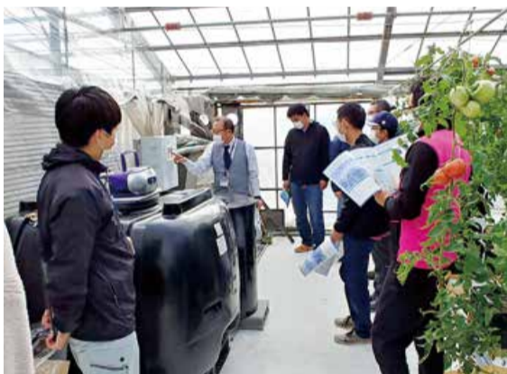
若手トマト農家研修会の様子

北区では農作業の省力化や担い手確保のため、農業へのICT導入を支援しています。農作業の一部を自動化して労力を軽減したり、ハウス内の環境をデータ化しています。ICT導入により常にトマトの生育環境を確認できるようになり品質向上や、収量増加による所得向上が期待できます。