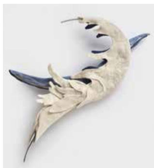
イシヤマヒロコ 《旅する風》