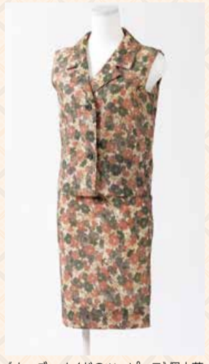
(オーダーメイドのワンピース)個人蔵