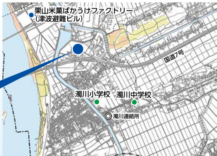
周辺の津波ハザードマップ