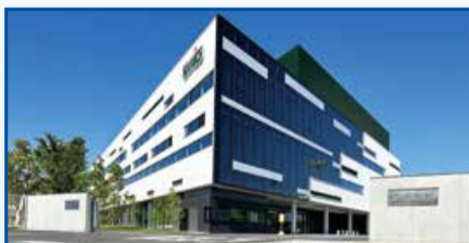
ナミックス株式会社(濁川3993番地)