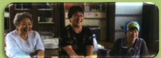
川端町自治会 サロンみちくさ