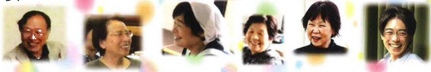
※写真は、北区にお住まいの皆様の素敵な笑顔の写真です！

今回は、この状況下でも人とのつながりを大切に、工夫している活動や、今の生活に役立つ情報をお届けします。皆様と笑顔を交わすことのできる時まで、元気に過ごして行きましょう！