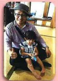
濁川地区民生委員 地域の茶の間にて